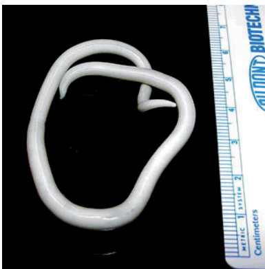
Weibchen des Spulwurmes ( Ascaris lumbricoides )

Die Beschreibung einiger Parasiten erspare ich Ihnen bewusst, dafür gibt es 400 Seiten Bücher voller Einzelheiten. Nur weil die meisten meiner Patienten glauben, Parasiten wären meterlange Gebilde, die auf eklige Art und Weise selbstständig aus dem Darm hüpfen, möchte ich hier Klarheit schaffen. Diese großen „Tagliatelle“, die man mit bloßem Augen sieht, sind Bandwürmer (Taeniae), mehr nicht. Leider sieht man die anderen Parasitentypen ohne Mikroskop gar nicht. Ich spreche hier von den Gattungen der Fadenwürmer (Spulwürmer), der Egel (Saugwürmer) und der Urtierchen (Protozoen). Sehr, sehr kompliziert, nicht wahr? Leichter zu verstehen wäre, wenn ich Ihnen verrate, dass es, je nach Ansiedlungsorgan, Leber-, Lungen-, Herz-, Bauchspeicheldrüsen-, Gehirn- oder Darmwürmer gibt, die entsprechende Symptome beim Menschen verursachen.